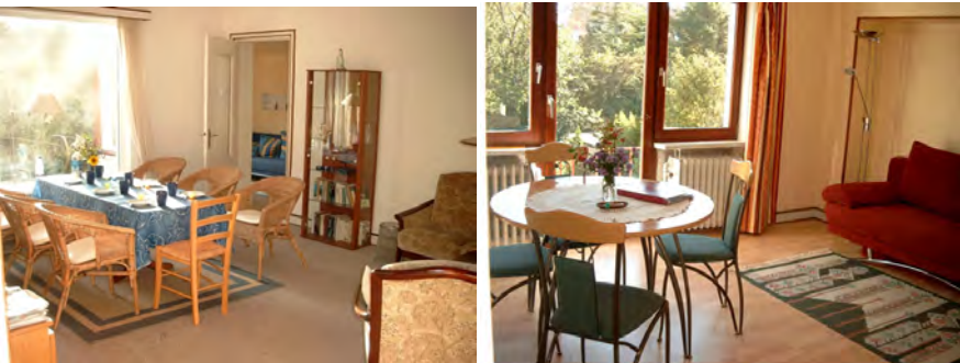
Erdgeschoss, Obergeschoss, Garten mit Laube

In der großen Wohnung in Parterre (ca. 90 qm) gibt es drei kleine Schlafräume für je zwei Personen, einen großen Wohnraum, den Wintergarten, eine große Küche mit Essplatz, ein behindertengerechtes Duschbad sowie eine Terrasse.