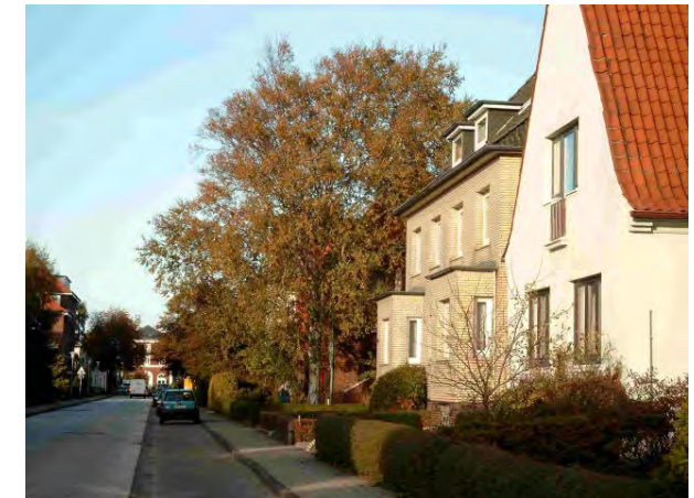
Hinter dem "Badehaus" am Straßenende ist der Deich

Information und Buchung: Beatrix Boldt Hohe Ähren 5 14195 Berlin